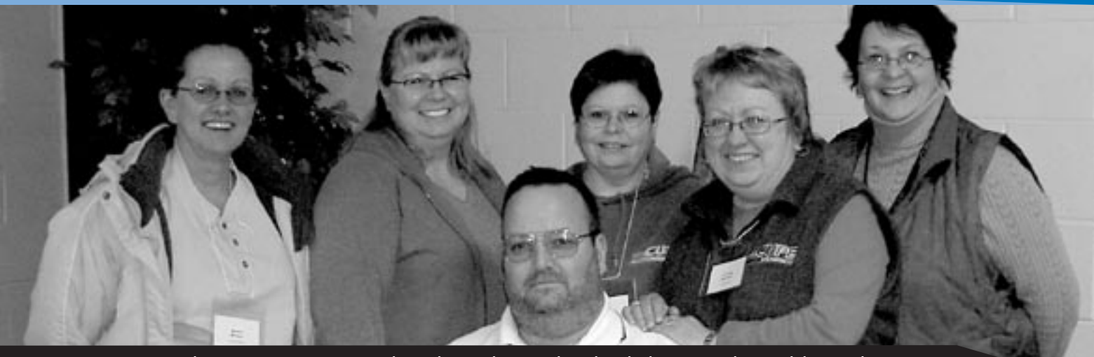
Mars 2005 : Nos membres ont appris à présenter des ateliers en langage clair à l'école du Congrès du travail du Canada.