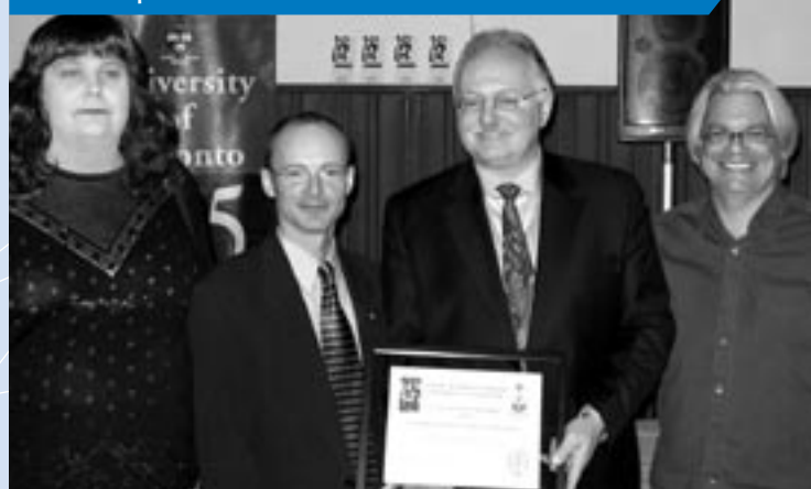
Le SCFP a reçu un prix de l'Université de Toronto pour son leadership en matière de défense de la diversité sexuelle.