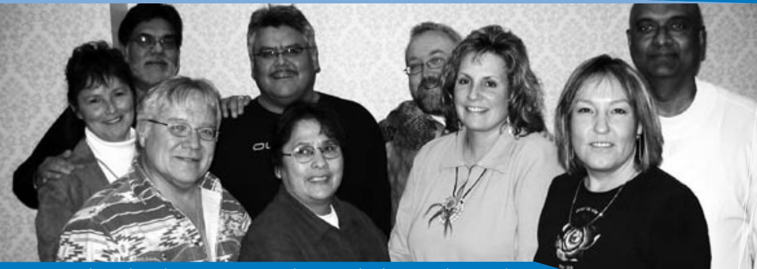
Le Groupe de travail autochtone est parmi ceux qui luttent pour l'égalité au nom de nos membres .