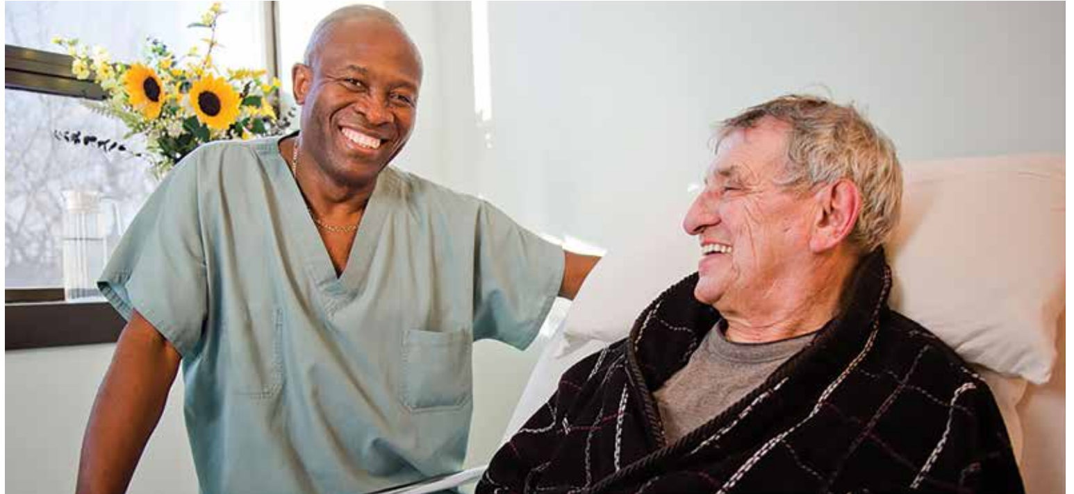
La nouvelle campagne publicitaire du Conseil provincial des affaires sociales (CPAS) du SFCP-Québec est intitulée Parlez-en aux périsoignants . Pour plus de détails, visitez le www.perisoignant.com .

« Nous voulons montrer à la population qu'il y a d'autres membres du personnel que les médecins et les infirmières. Dans un hôpital, il y a aussi tous les autres titres d'emploi, comme les préposés aux bénéficiaires, le personnel de bureau, les travailleurs à l'entretien,