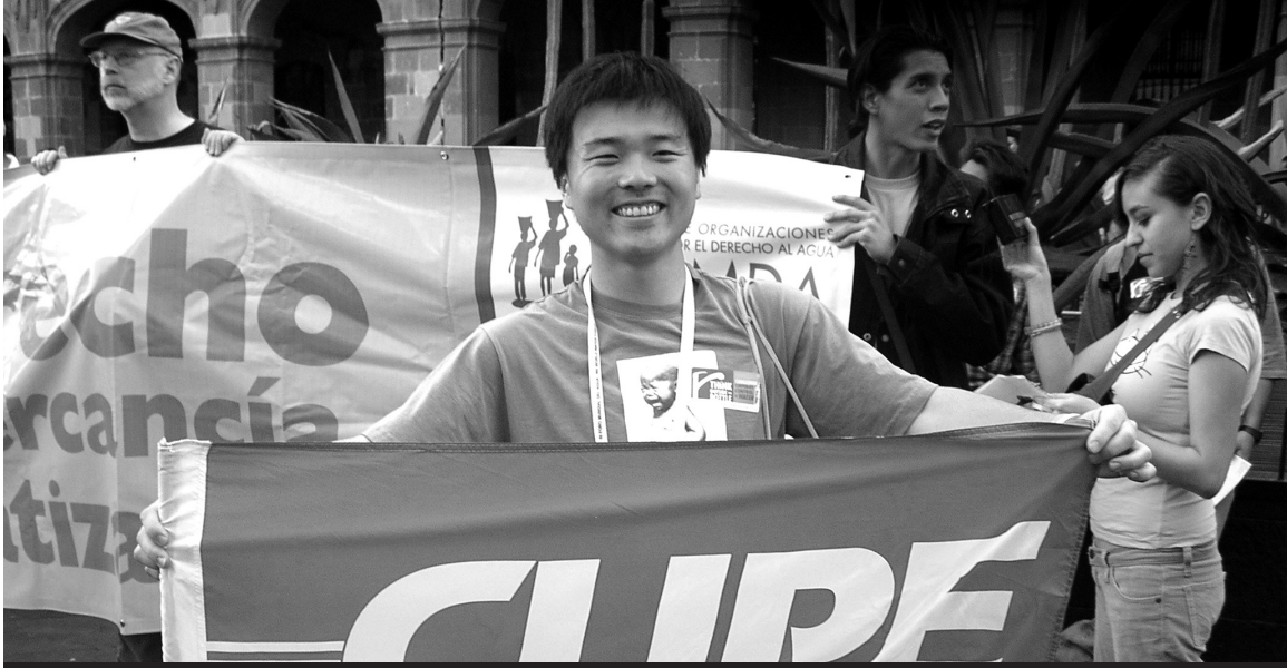
Un militant japonais se fait photographier avec la banderole du SCFP à l'activité organisée pour la Journée mondiale de l'eau à Mexico, en mars 2006