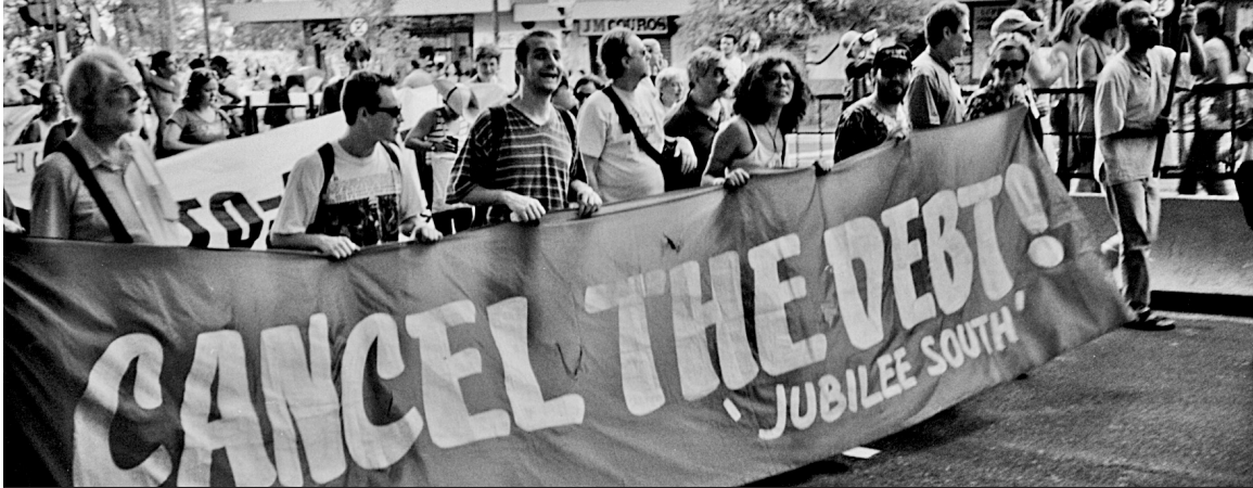
Des membres du SCFP manifestent avec d'autres pour exiger l'annulation de la dette des pays du tiers monde

Le SCFP contribue régulièrement à des déclarations internationales comme celle du Conseil exécutif du CTC, en mai 2006, qui demandait au Canada de retirer ses troupes de l'Afghanistan et d'appuyer les efforts d'édification de la paix au Darfour.