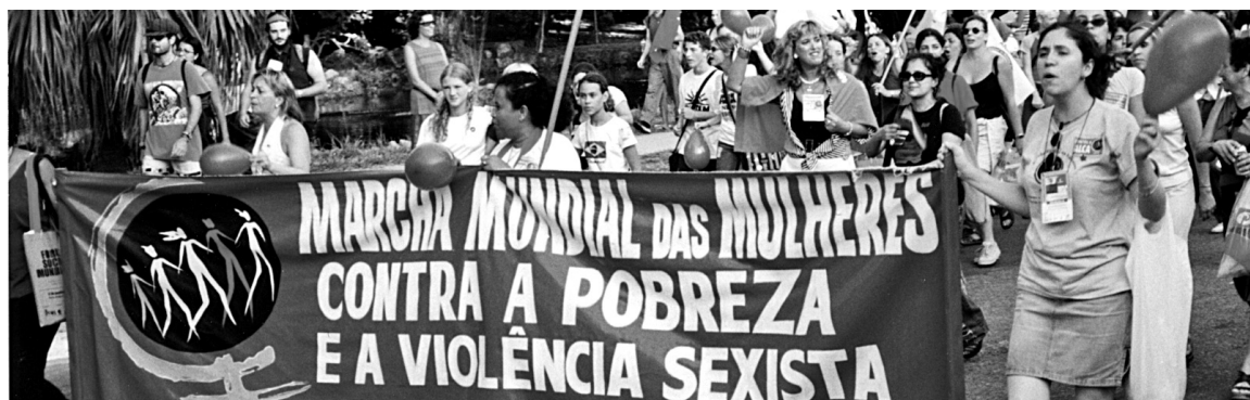
Les membres du SCFP participent à la Marche mondiale des femmes

Nous sommes solidaires de nos consœurs et confrères du Congress of South African Trade Unions (COSATU) dans leurs luttes contre les politiques néolibérales